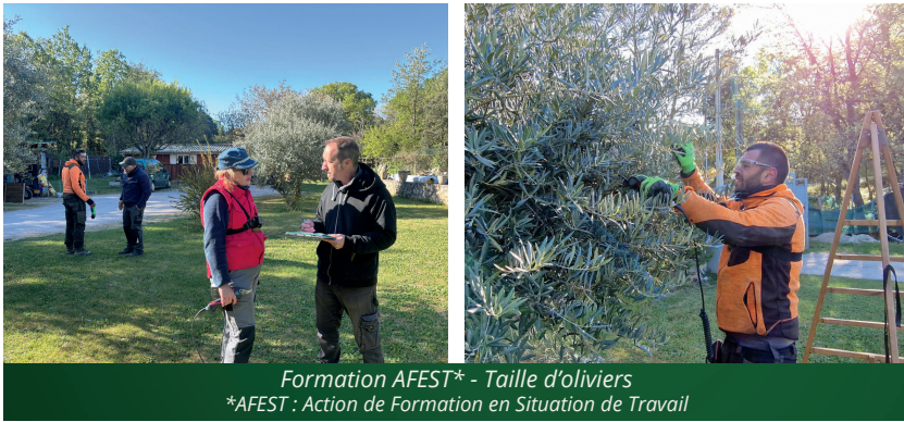
Formation AFEST* - Taille d'oliviers *AFEST : Action de Formation en Situation de Travail

En résumé, nous espérons poursuivre notre mission de ces dernières années : embaucher des personnes privées durablement d'emploi tout en continuant à vous servir avec enthousiasme !